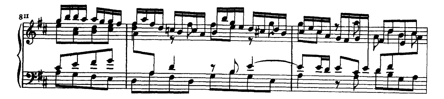
* Die Cantate ist ein Torso. Verloren gegangen sind: 1. durch das ganze Werk der Continuo, 2. im 1. Chore a. von den Singstimmen der Bass und Tenor b. muthmasslich 2 Trompeten und die Pauken. Das Fehlende ist vom Bearbeiter ergänzt. Die Trompeten treten in Takt 3 und 4, sowie in der 2. Hälfte von 7 und 6, ferner an den entsprechenden Stellen im weiteren Verlauf des Satzes melodieführend auf.