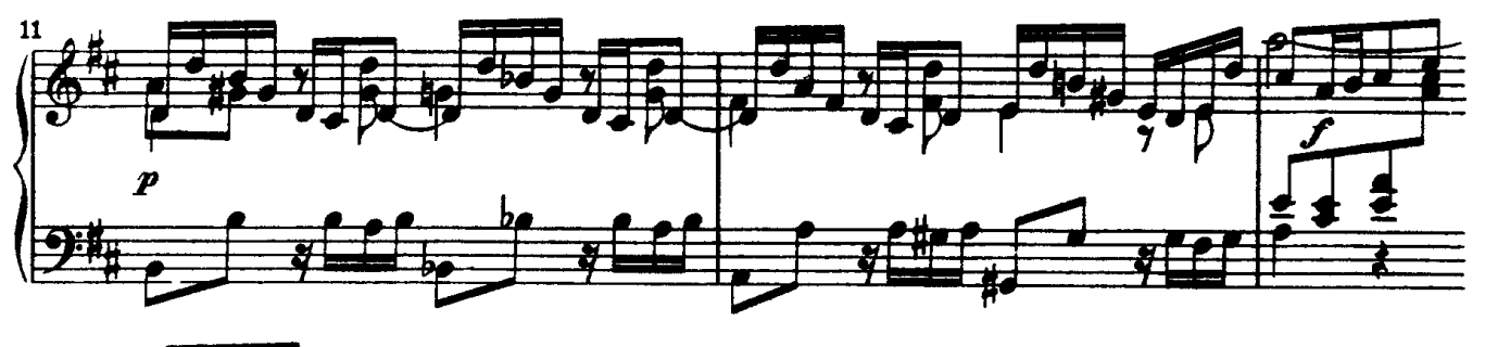
J.S. Bach - Church Cantatas BWV 193