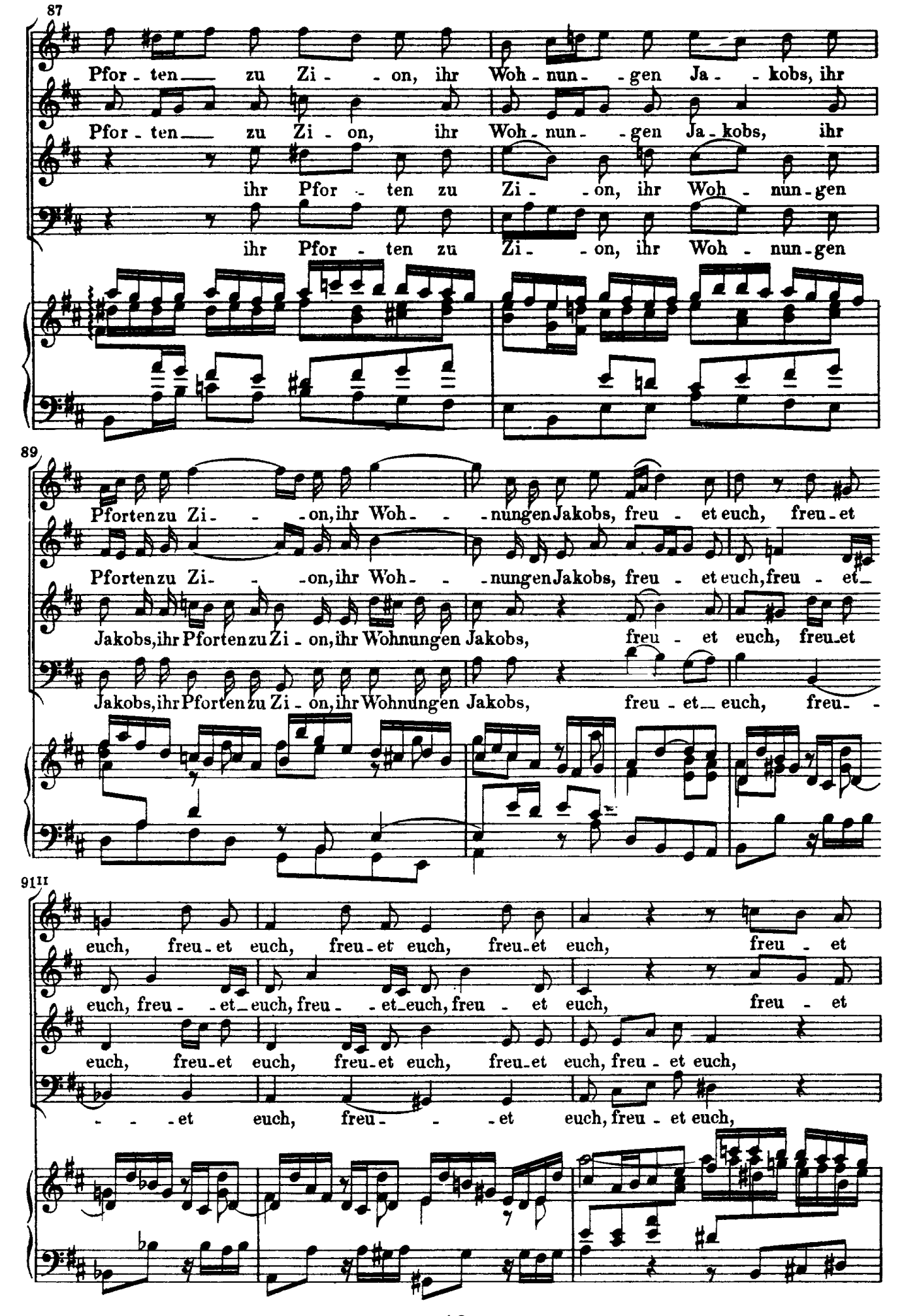
J.S. Bach - Church Cantatas BWV 193